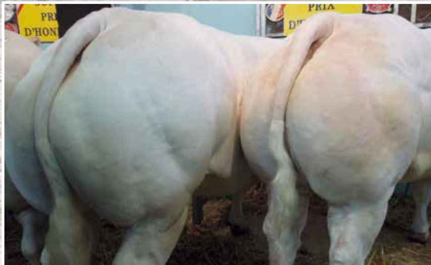
VARENNES SUR ALLIER