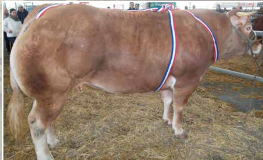
SAINT YRIEX LA PERCHE