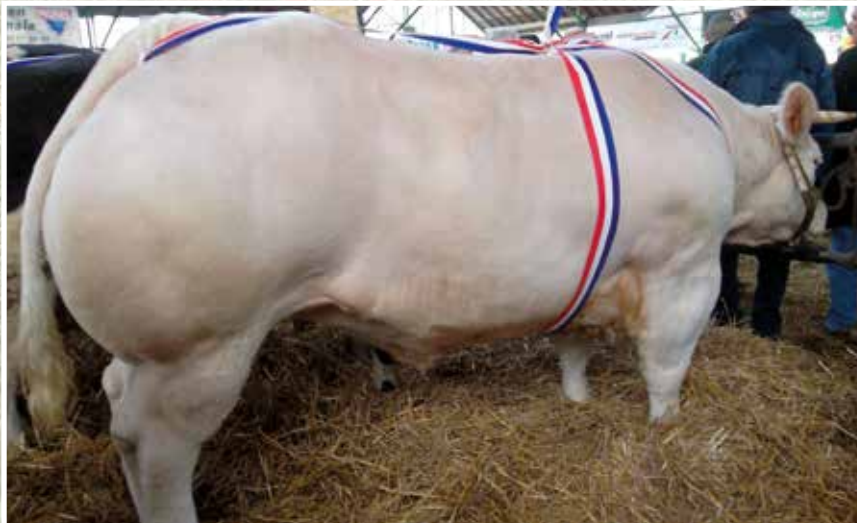
TORIGNI SUR VIRE