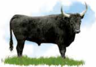
Raço di Biòu