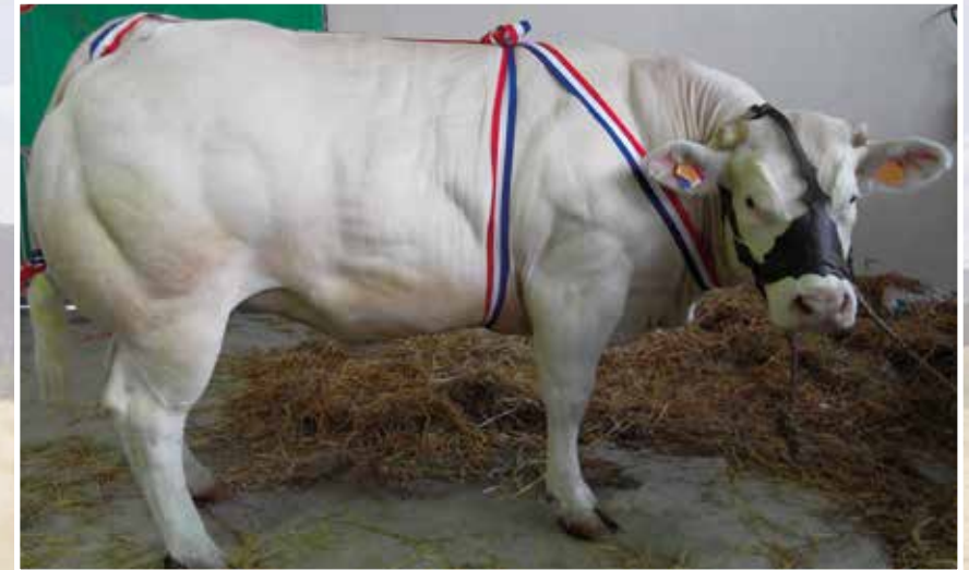
ST POURÇAIN S./ SIOULE