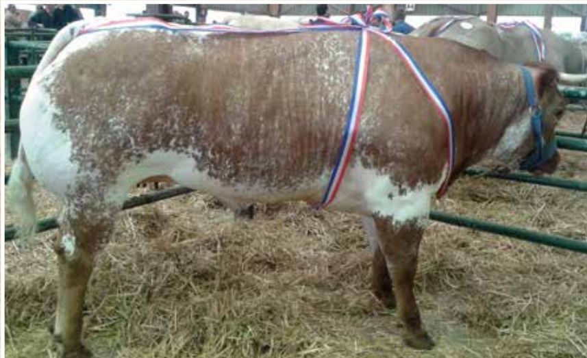
FORGES LES EAUX